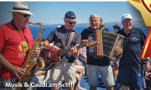
Musik & Gaudi am Schiff